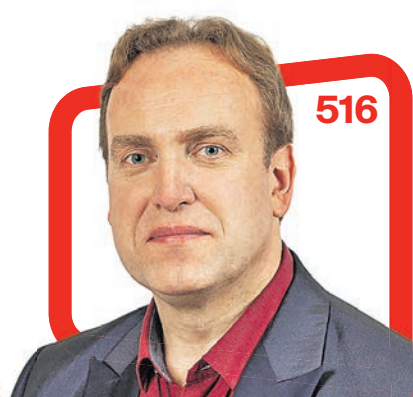
Anti Allas Võru linnaeape