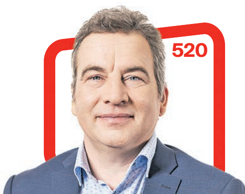
Raul Kudre Setomaa vallavanem