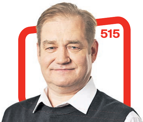
Ivari Padar Riigikogu liige

Toimetulek on julgeolek! Sellepärast vali neil valimistel sotsiaaldemokraadid. Vali südamega!